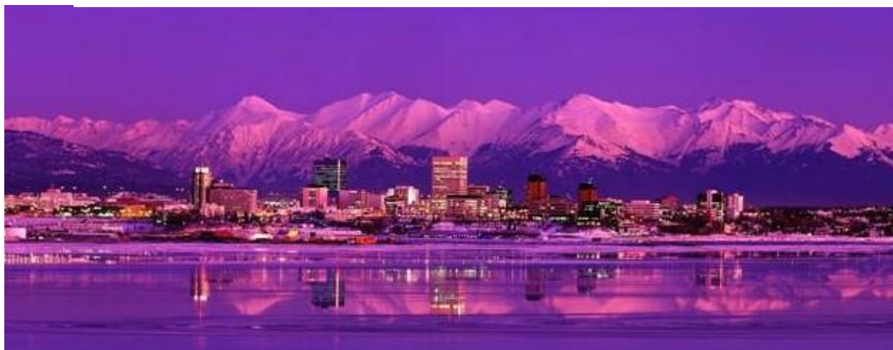
- obrázek znázorňuje Anchorage na Aljašce