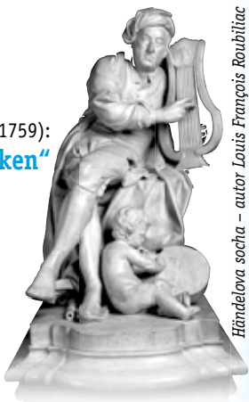
Händelova socha – autor Louis François Roubiliac